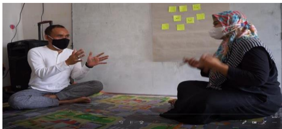
Gambar 5. Sesi Praktek One-on-One

Dalam materi tentang coaching , praktik dan evaluasi merupakan dua aktivitas yang berbeda. "Praktik" disini adalah mempraktikkan materi coaching yang diterima saat webinar ke dalam aktivitas dan kehidupan pekerjaan sehari-hari, lalu membuat memaparkan laporan hasil coaching yang sebelumnya telah dikerjakan yang akan dinilai oleh pelaksana abdimas. Sedangkan "evaluasi" adalah melihat secara langsung praktik melakukan coaching dengan metode role play .