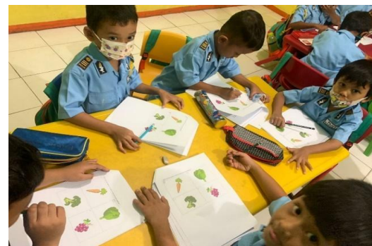
Gambar 6. Pengisian pre-test dan post-test