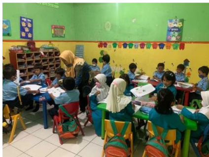
Gambar 2. Pelaksanaan kegiatan edukasi gizi di TK Islam Qolbus Salim

Kegiatan dilaksanakan selama satu hari dan berlangsung selama 90 menit. Berikut foto kegiatan yang telah dilaksanakan: