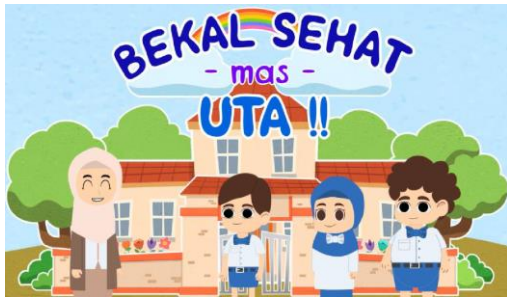
Gambar 1. Animasi digital “Bekal Sehat Mas Uta”