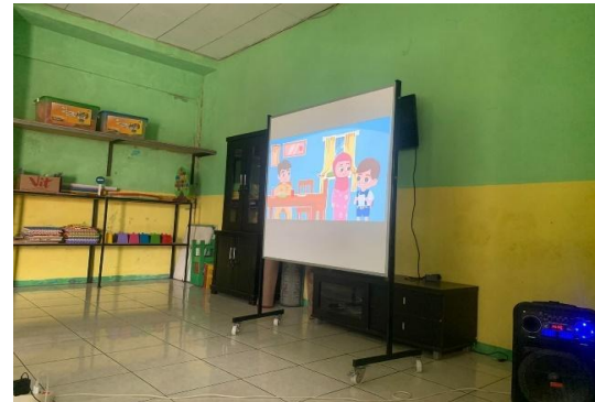
Gambar 5. Pemutaran animasi digital

meningkatkan pengetahuan gizi anak, namun juga dapat mengubah perilaku makan anak ke arah yang lebih baik dengan adanya dukungan dari berbagai pihak. Berikut disajikan beberapa dokumentasi kegiatan edukasi gizi dengan media animasi digital yang telah dilakukan di TK Islam Qolbus Salim.