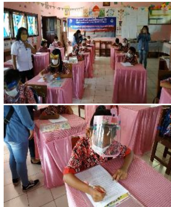
Gambar 4. Kegiatan pemberian tes akhir (postest) terhadap mitra

Tes akhir (postes) dilaksanakan untuk mengukur tingkat keberhasilan dan efektivitas dari kegiatan yang dilakukan. Soal yang diberikan sebanyak 15 soal dalam bentuk pilihan berganda. Waktu yang diberikan selama 15 menit. Peserta yang mengikuti tes ini sebanyak 50 siswa (Gambar 4). Materi test mencakup materi yang disampaikan secara tatap muka dan hasil pemutaran video. Hasil menunjukkan adanya peningkatan nilai tes akhir dibandingkan dengan test awal (Gambar 5). Hal ini berarti terjadinya peningkatan pemahaman dan pengetahuan peserta terhadap pengelolaan sampah dengan konsep 3R setelah dilaksanakan kegiatan penyuluhan.