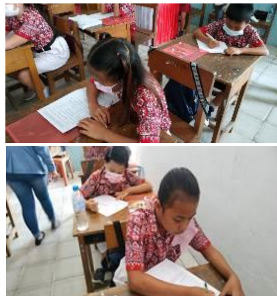
Gambar 1. Kegiatan pemberian tes awal (Pretes) terhadap mitra untuk mengukur pengetahuan siswa sekolah dasar tentang pengelolaan sampah dengan konsep 3R

Pretes berbentuk pilihan berganda dengan jumlah soal sebanyak 15 soal. Waktu yang diberikan selama 15 menit. Jumlah peserta yang mengikuti pretest sebanyak 50 orang.