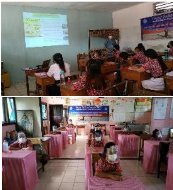
Gambar 3. Pemberian teori kepada mitra tentang pengelolaan sampah dengan konsep 3R

Pemberian teori dan pelatihan dilaksanakan secara luring atau pertemuan tatap muka dengan tetap memperhatikan protokol kesehatan dengan maksimum 25 peserta setiap sekolah (Gambar 3). Jumlah peserta yang mengikuti kegiatan sebanyak 50 orang siswa sekolah dasar. Peserta kegiatan sangat antusias mengikuti kegiatan tersebut. Antusiasme peserta tergambar dari banyaknya peserta yang hadir pada kegiatan pengelolaan sampah dengan konsep 3R dalam upaya pemberdayaan siswa untuk menjaga kebersihan lingkungan.