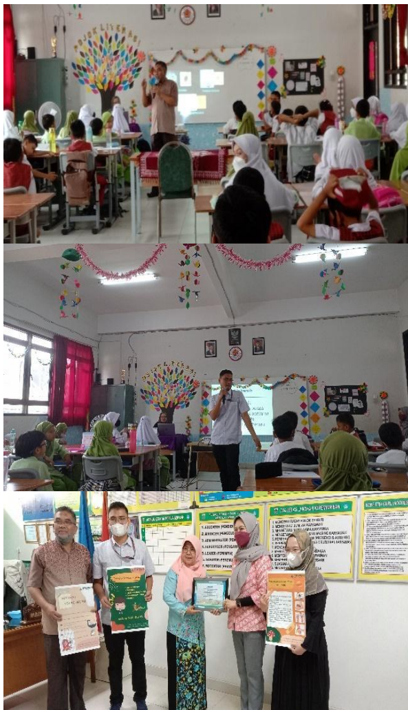
Gambar 4. Dokumentasi kegiatan pengabdian kepada masyarakat

Pada kegiatan selanjutnya akan dilakukan survei menegenai pemahaman kecacingan setelah dilakukan penyuluhan. Untuk dapat mengetahui angka infeksi kecacingan dapat dilakukan pemeriksaan menggunakan sampel feses (Pramitaningrum, 2019).