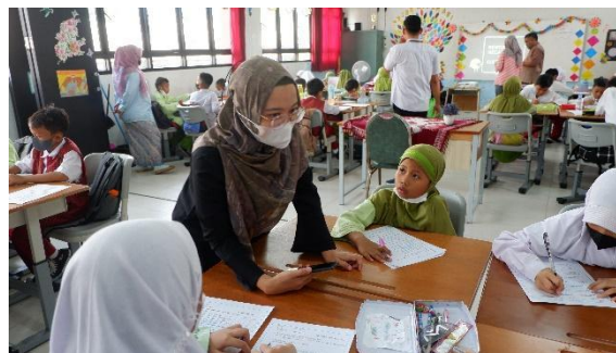
Gambar 1. Proses pengisian kuesioner penyebab dan bahaya kecacingan

Kegiatan ini diikuti oleh 50 siswa kelas 3, kepala sekolah, dan 6 guru pendamping. Kegiatan diawali dengan membagikan kuesioner untuk mengetahui pemahaman siswa mengenai penyebab dan bahaya kecacingan.