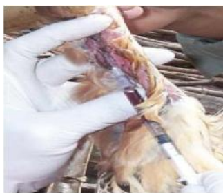
Gambar 1. Pengambilan Sampel Darah

H5N1 pada unggas peliharaan masyarakat yang berada di sekitar kawasan CAPD sehingga dapat dijadikan acuan dalam upaya pencegahan penyebaran virus AI subtype H5N1 pada unggas peliharaan dan burung liar.