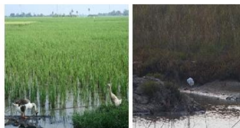
Gambar 3. Persawahan di sekitar CAPD. Kiri: unggas domestik mencari makan., Kanan: burung air liar yang berkeliaran mencari makan di tambak yang sama dengan tempat unggas domestik mencari makan

Tidak timbulnya gejala klinis infeksi AI pada hewan uji diperkirakan karena unggas domestik terpapar sedikit demi sedikit sehingga paparan ini mampu menstimulasi timbulnya antibodi anti H5N1 tetapi tidak cukup untuk menimbulkan gejala secara klinis (Subbarao & Katz, 2000). Penelitian sebelumnya yang dilakukan oleh Kurniawati (2011) dan Bustami (2011) pada burung air liar di kawasan CAPD menunjukkan nilai titer antibodi H5N1 yang jauh lebih rendah dari titer antibodi pada ayam, itik dan mentok. Titer antibodi burung air liar tersebut yaitu 2 0,583 pada burung Kuntul Besar, 2 0,286 Kuntul Sedang, 2 0,32 Kuntul Kecil dan 2 0,28 Kowak