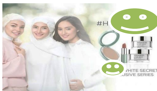
Gambar 5. Contoh iklan non makanan dengan kalim ‘Halal’