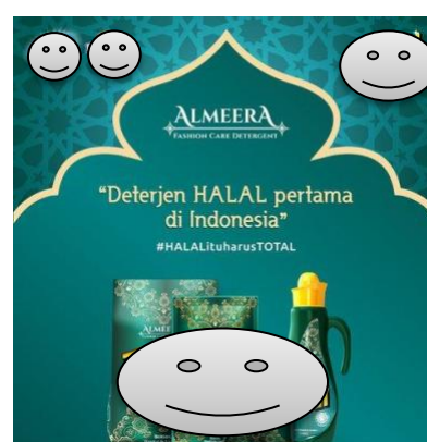
Gambar 6. Contoh iklan non makanan dengan klaim ‘Halal’