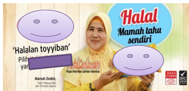
Gambar 1. Tokoh agama sebagai model iklan

Sumber : Berita-Bisnis. https://www.berita-bisnis.com/gandeng-mamah-dedeh-mega-global-food-pacu-penjualan-kokola/